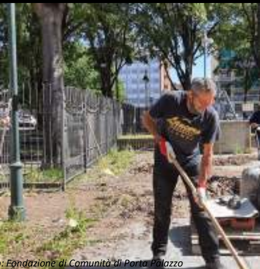
Fondazione di Comunità di Porta Palazzo